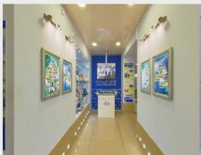
Постоянно действующая выставка НАН Беларуси «Исследования. Разработки. Производство» (2024)