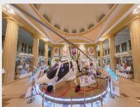
Экспозиция НАН Беларуси на Международной выставке-форуме «Россия» (04.11.2023 - 07.01.2024, Москва, ВДНХ)