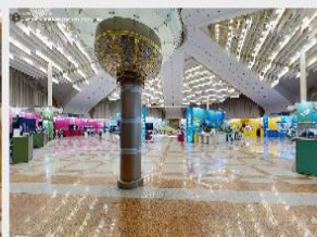
Беларусь интеллектуальная в Минске (2023) / Matterhub