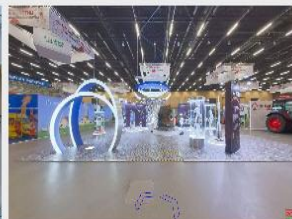
Экспозиция НАН Беларуси на выставке «Моя Беларусь» (2025)