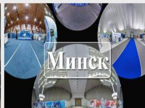
Беларусь интеллектуальная (2023)